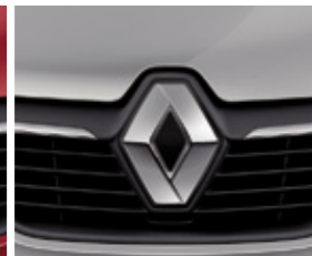
GRIS PLATINE (TE)**