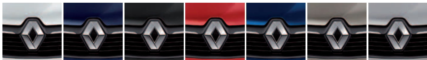
BLANC GLACIER (OV) BLEU NAVY (OV) NOIR NACRÉ (TE) ROUGE DE FEU (TE) BLEU PERSAN (TE) BEIGE CENDRÉ (TE) GRIS PLATINE (TE)

OPAQUE, MÉTALLISÉE... LA PALETTE DE COULEURS S'AFFICHE.